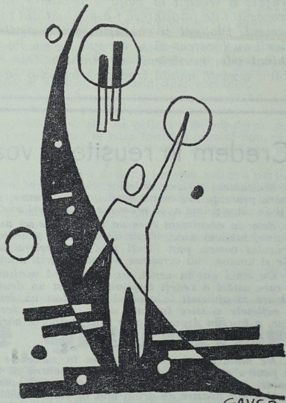
Desen de G. Constantin

care au numărat clădirile complexului studențesc. Ce ar fi să numărăm încă o dată ca oamenii, nu ca... înaintea lansării. ★ Luînd în serios socoteala făcută de noi la minutele pe care le pierdem zilnic între cantină și cămin, refuzînd să se odihnească, un coleg de-al nostru, a numărat pașii dintre cămin, cantină, facultate, clinici dus-intors și i-au ieșit 15.321,5. Probabil greșise cu jumătate de pas. ★ O echipă de cinești de la studioul „Alexandru Sahia” au consemnat pe peliculă aspecte din viața și activitatea institutului nostru. Pe cele cîteva vedete rămase printre noi din epoca filmului cu suspense sperăm să le recunoaștem în jurnalul promis. ★ Pentru cei care se pare că au uitat poveștile copilăriei, reamintim că Thrombeldimbar, nu este o năstrușnică înpercherere de cuvinte ci numele unui pitic năzdrăvan (un fel de Piticul-Barbă-Cot) din basmele nordice. Asta pentru a sfîrși o dată cu „poveștile”. ★ De cînd lumea primăvara vine cu flori. Numai la căminele patru și cinci, primăvara începe cu albe pachete în ferestre. Dacă nu am avea dulăpioarele acelea am mai zice... ★ De închiriat pentru nunți, pentru baluri, și pentru orice fel de petrecere cele opt săli de lectură ale căminelor din complex. Doar sesiunea a trecut. ★ Aflăm gîtuții de emoție că studentul Măntăluță din anul întâi al facultății de zootehnic, a întrecut toate așteptările. Răs-