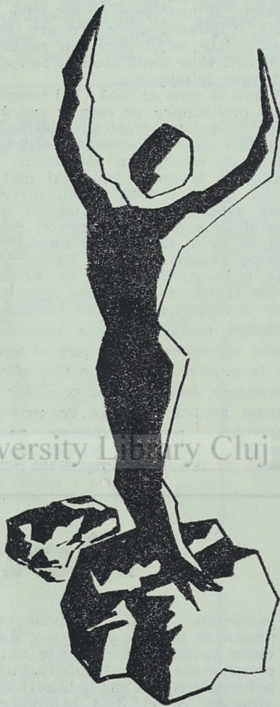
Desen de G. Constantin

R. Care este senzația care îl încearcă pe un autor la apariția unui nou volum al său?